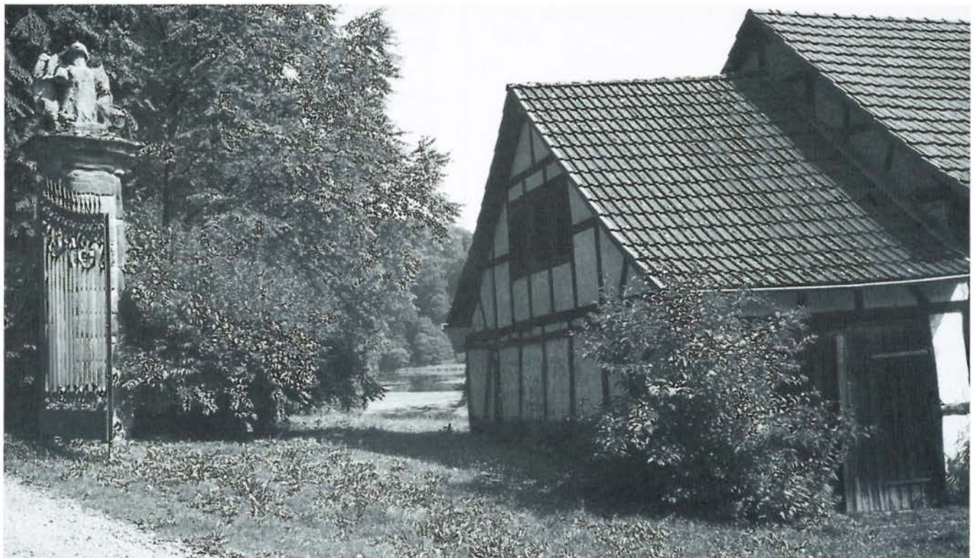
Torbereich von Burg Herrstein

Das erste Ziel dieser Fahrt, Burg Herrstein, liegt, wie es heißt, »malerisch und das Tal mächtig beherrschend«, auf einem steilen Felsen im Bröltal. Dem Namen nach war sie wohl ursprünglich der Stammsitz der Herren von Steyne, fiel aber schon im 14. Jahrhundert an die Herren von Nesselrode-Reichenstein und ist seit 1825 im Besitz der Linie Droste-Vischering zu Nesselrode-Reichenstein. Mit seiner Verbindung von Höhenburg (Haupthaus) und Wasserburg (Wirtschaftsgebäude im Tal) gilt Herrstein noch heute als eine der ein-