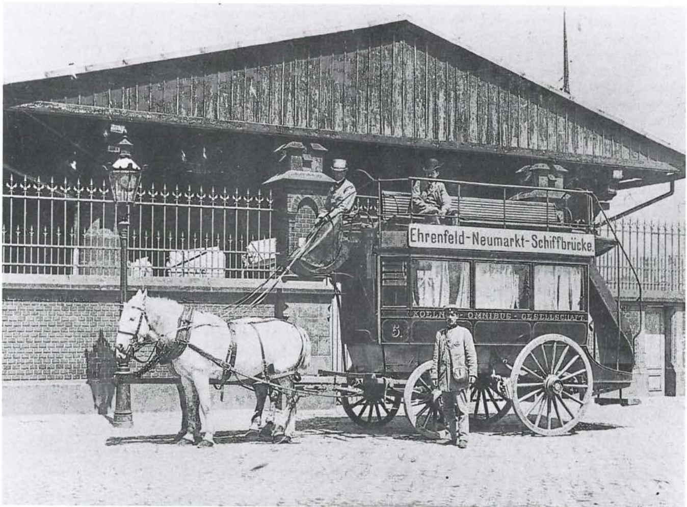
Ein Pferde-»Omnibus« der Linie Ehrenfeld-Neumarkt-Schiffbrücke