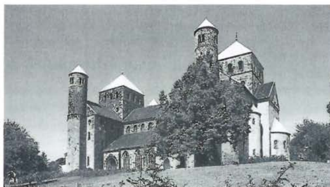
Die evangelische Kirche St. Michael in Hildesheim

Am 5. Juni fahren wir in Richtung Westen mit einem kurzen Besuch in Hameln, der Stadt des Rattenfängers. Hauptziel ist diesmal Hildesheim. Mit dem Dom und der Kirche St. Michael gibt es gleich zwei Bauwerke,