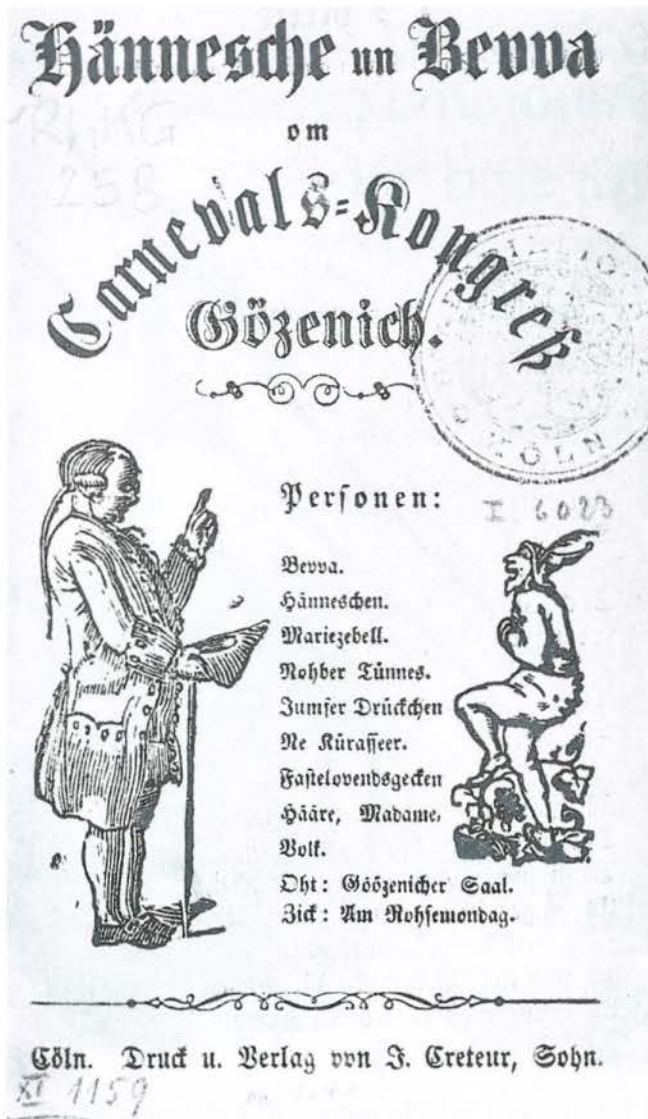
Titelblatt eines Schwanks von Joh. Matth. Firmenich

meist unveröffentlichte Quellenmaterial; hier gibt es am ehesten Parallelen zu, teilweise auch Überschneidungen mit dem schon erwähnten »Kölner Autoren-Lexikon«, nicht verwunderlich, weil dort ja die Materialien von Gertrud Wegener benutzt wurden. Aber es gibt auch Unterschiede, nicht nur in Nuancen, und die Autorin ebenso wie ich als Herausgeber haben unseren Ehrgeiz darein gesetzt, dass an den Stellen, an denen die Angaben nicht übereinstimmen, die Version unseres Buches noch einmal eigens überprüft wurde. Mit einem ausführlichen Literaturverzeichnis zu Thema und Zeit (S. 279–308) und einem Namenregister (S. 309–316) wird der Charakter des Nachschlagewerks verstärkt.