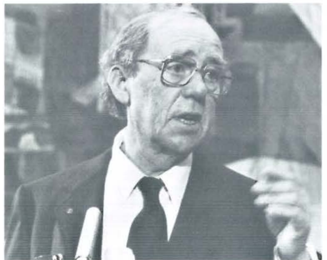
Heinrich Böll als Ehrenbürger der Stadt Köln

extremes Produkt der arbeitsteiligen Gesellschaft, der zunehmenden Spezialisierung unter den strengen Bedingungen von Angebot und Nachfrage der Wirtschaftswunderwelt. Der Autor hat sein erstes Ziel dann erreicht,