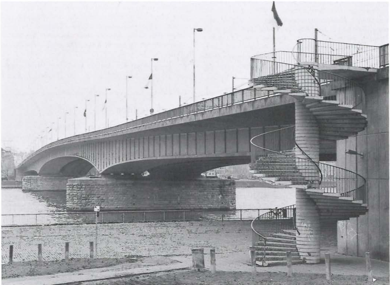
Zwischen Köln und Deutz: ne Bleck vun Düx noh Kölle im Jahr 2000