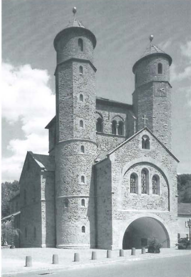
Westwerk der Stiftskirche zu Bad Münstereifel

aber dass die Römer Glas machen konnten und es im Rheinland auch taten, dafür gibt es ja großartige Beweisstücke gerade im Kölner Römisch-Germanischen Museum, und die Voraussetzungen waren auch in der Eifel gegeben. Trotz des Sonntags besteht die Möglichkeit, Produkte der Glashütte zu erwerben. – Das Mittagessen werden wir in der »Alten Mälzerei« einnehmen, die von einer sympathischen Familie aus Griechenland geführt wird; wir dürfen uns überraschen lassen. – Am Nachmittag stehen, nach einem kurzen