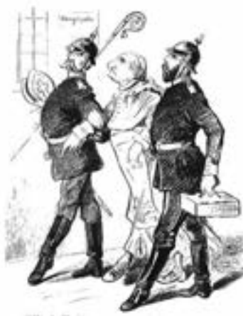
Abb.: Hermann Scherenberg (1826–1897): Vom letzten Umzugstermin:

Doch im sog. „Kulturkampf“ nach der Reichsgründung kam es mit dem „Hilje Kölle“ wieder zu Verwerfungen zwischen der katholisch geprägten Stadt und ihrem protestantischen Staat, was das Schicksal des Erzbischofs Paulus Kardinal Melchers zeigt, der wegen seiner Unbotmäßigkeit sogar im Klingelpütz einsitzen musste. Am 28. Juni 1876 wurde er gar vom Gerichtshof für kirchliche Angelegenheiten abgesetzt. Melchers ging ins Exil in die holländische Provinz Limburg, von wo er seine Amtstätigkeit durch einen Geheimdelegierten fortzusetzen suchte.