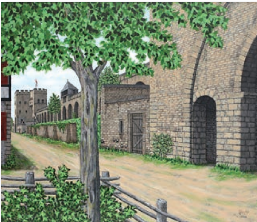
Siegfried Glos: Blick vom Ehrentor zum Hahnentor